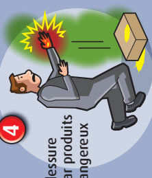
4 Blessure par produits dangereux