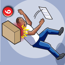
6 Chute d'objet