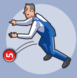
5 Chute de hauteur