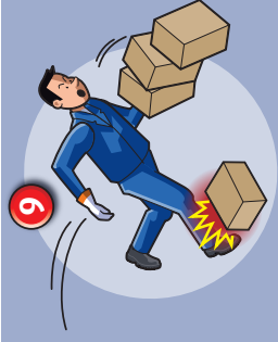
9 Chute de plain-pied