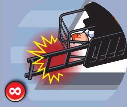
8 Collision engine/porte