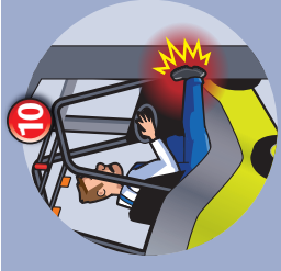
10 Choc du conducteur