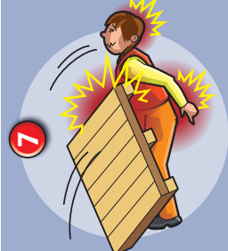
7 Chute d'une palette