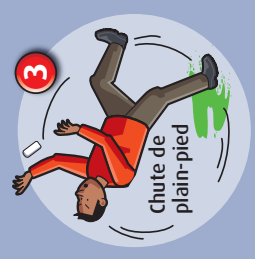
3 Chute de plain-pied