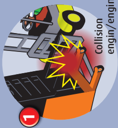
1 Collision engine/engine