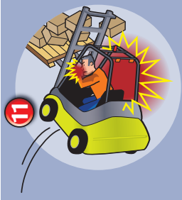
11 Renversement du chariot